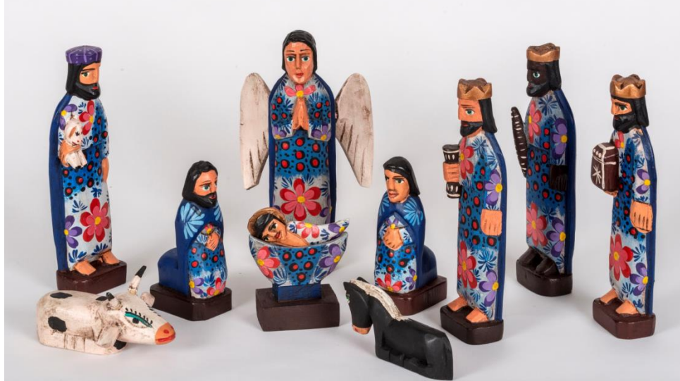
Majakrippe aus Guatemala (aus dem Diözesanmuseum)