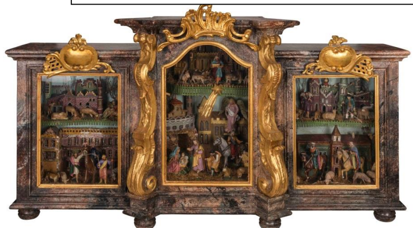
Barocker Schrein aus Böhmen mit Krippe