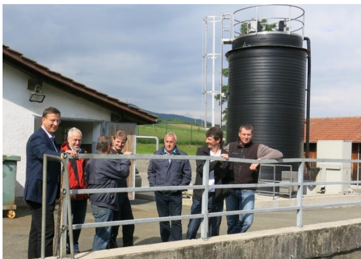
Foto: Marktrat besichtigt Neukirchener Kläranlage.

Wer diese Einleitungsverbote nicht beachtet, haftet der Gemeinde für alle dadurch entstehenden Schäden und Nachteile. Ferner handelt es sich hierbei um eine Ordnungswidrigkeit, die mit Geldbuße belegt werden kann.