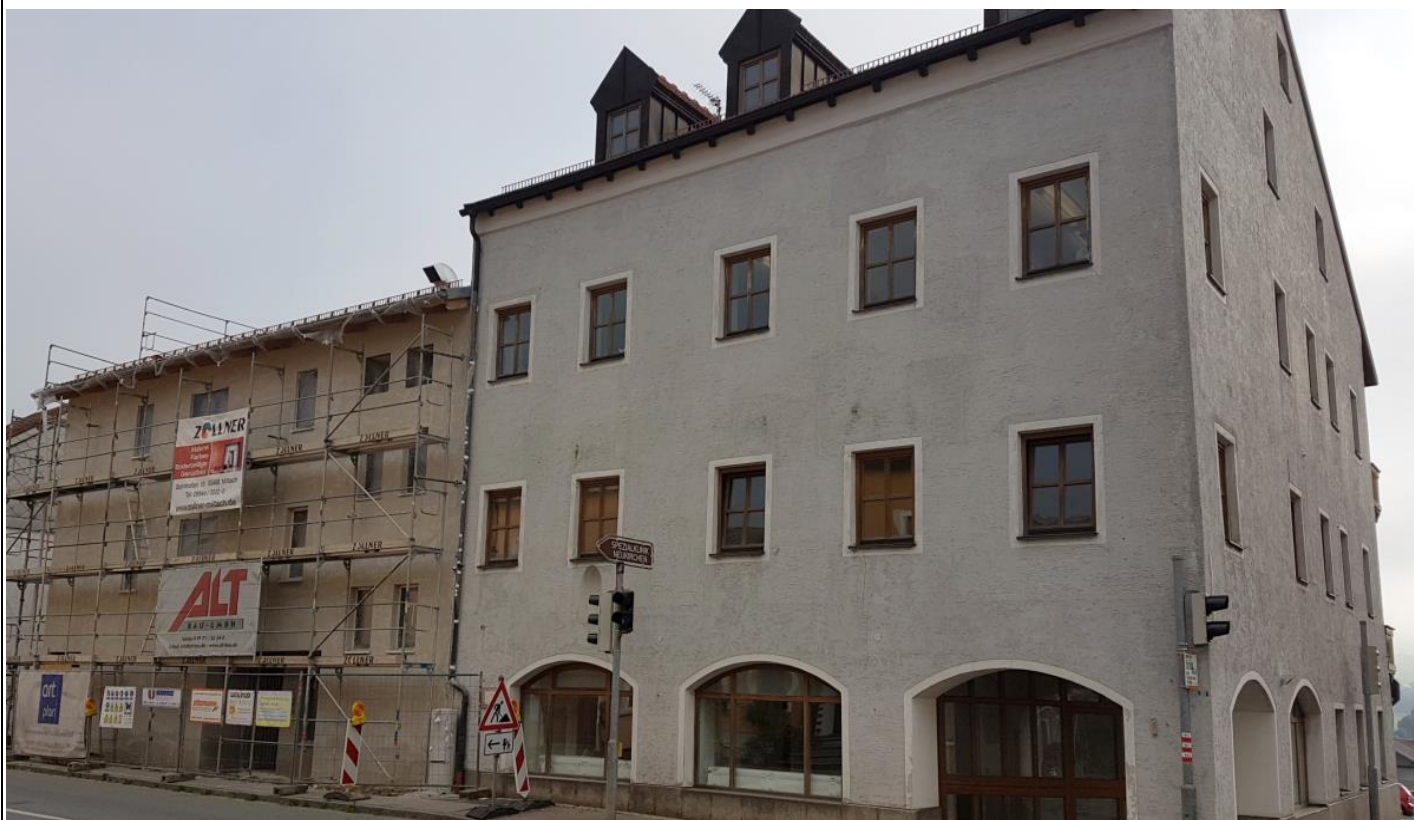
Foto: An Stelle des „Erlebach-Hauses“ und dem früheren „Hotel“ entsteht die zweite Senioren-WG.