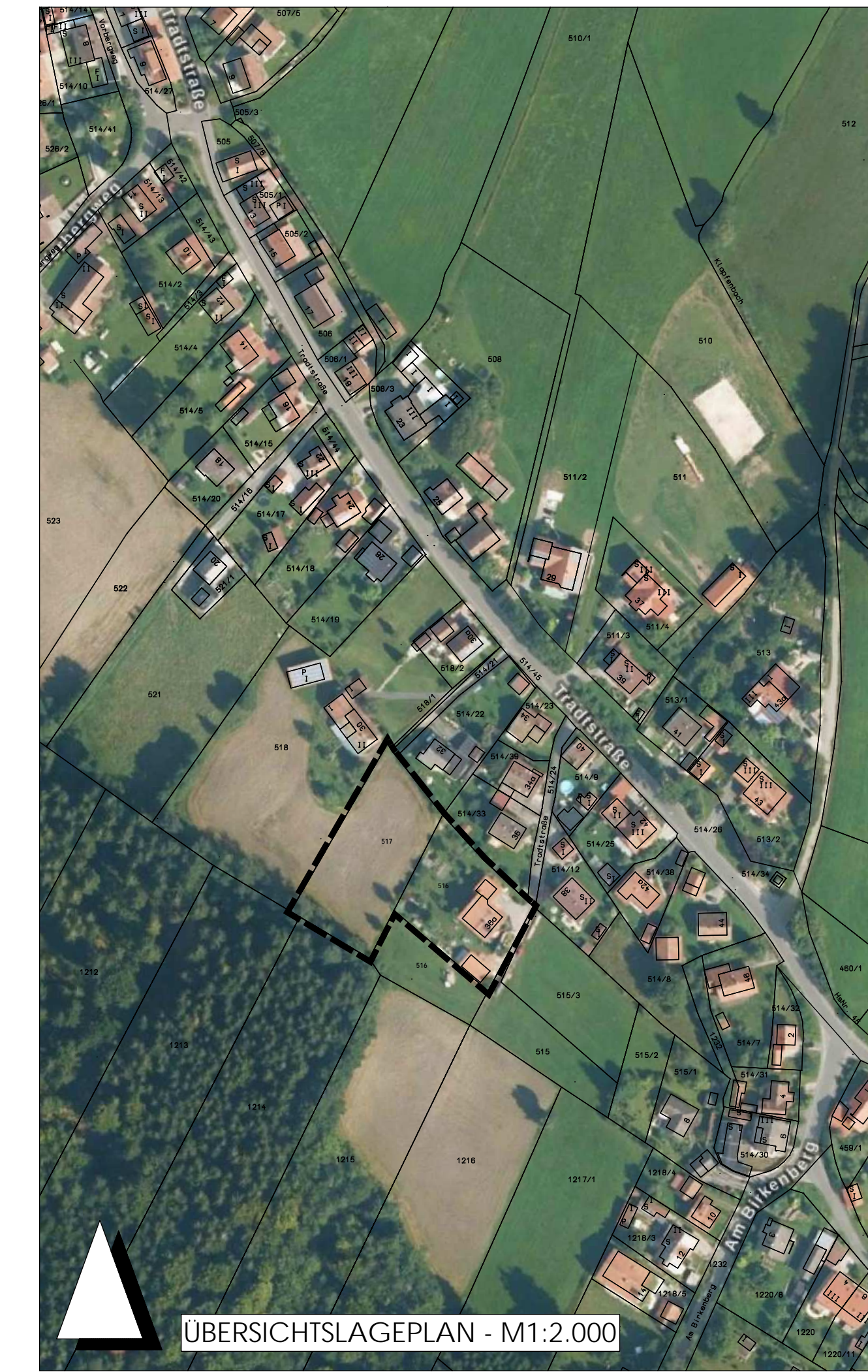
ÜBERSICHTSLAGEPLAN - M1:2.000