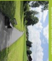
Redweg: unterhalb Naturbad