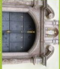
Wahrheitskirche Maria Geburt