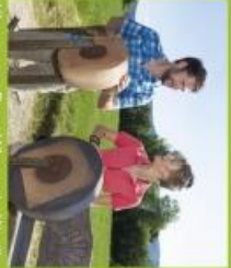
Kleinweg: „Dem Hören ein Weg.“