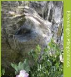
Benurstein beim Retheus