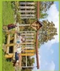
Jacobsweg bei Brunst