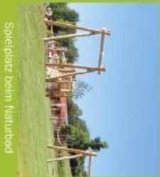
Spielplatz beim Naturbad